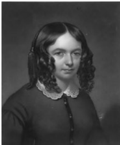
Elizabeth Barret Browning, (1806 -1861)