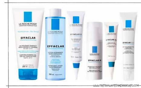
Cuidado de la piel (grandes superficies)