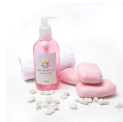
Higiene y Tocador