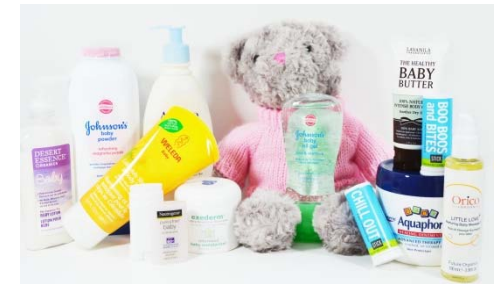
Productos para niños